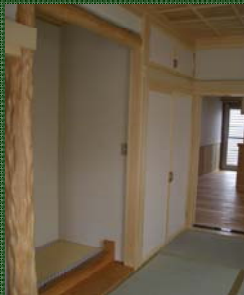
業が光る和室・床の間

樹皮に近い方が木表なんだ。人が触れる方を木表にしないと、時間が経つにつれて割れやトゲが刺さりやすくなるため人の肌に触れる側を木表にするんだよ」と棟梁は語る。