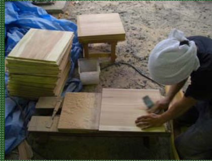
格天井に使うスギに浮造りを施す

長年の経験に裏打ちされた匠の業と目で着実に三木の森林の材木たちは家へと変化を遂げていきます。 「木には表と裏があつて、丸太の時、樹心に近い方が木裏