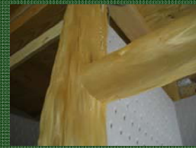
丸い床柱に丸い丸太を差し込む高度な技術 (写真上から2枚目)