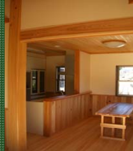
全て『三木の森林材』