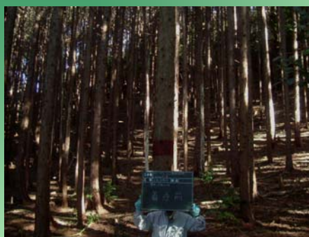
光が届かない真っ暗な森林が