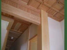
大黒柱に鴨居を差込みスギをふんだんに使った格天井