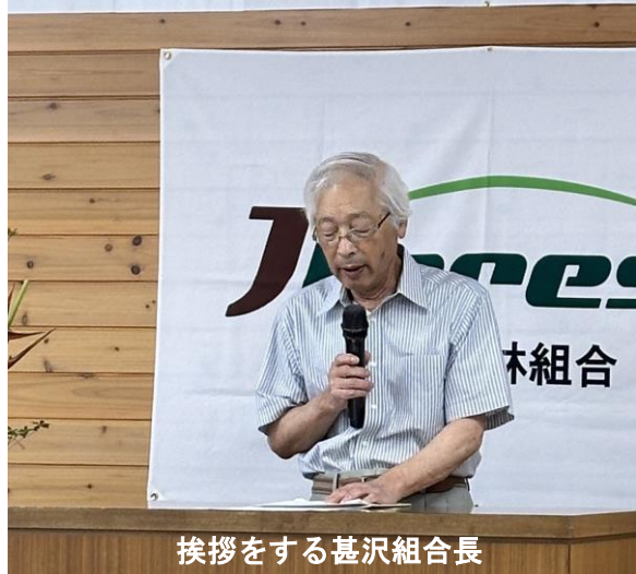
挨拶をする甚沢組合長